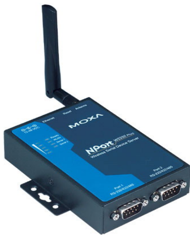
Convertor Serie RS232/Wi-Fi